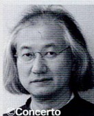
矢崎彦太郎 (指揮) Hikotaro Yazaki Conductor