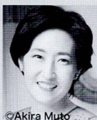
吉野直子 (ハープ) Naoko Yoshino Harp