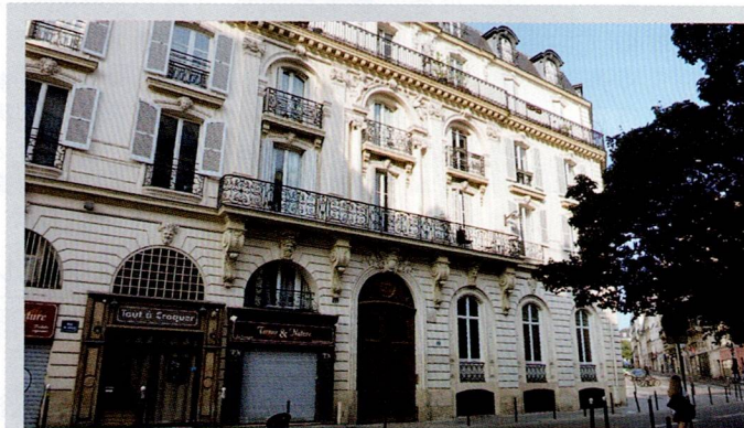
ビゼーが1869年から1875年にブーヅヴァル(パリ近郊)で亡くなるまで住んだドゥエ通りのアパルトマン。(22, Rue de Douai パリ9区)「カルメン」だけでなく、「アルルの女」も、この家で作曲された。ビゼーの住居であった事を示すパネルが外壁に取り付けられ、入口ドアの上には、フランス芸術保護建造物と標記されている。「カルメン」の台本作者の一人であるリュドヴィック・アレヴィ(Ludovic Halévy)はビゼーと姻戚関係にあり、同じ建物に住んでいた。

スペイン系の子修道会が運営する鎌倉清泉小学校に私は入学した。「頼朝の墓」参道脇にあった我が家の斜向いが学校で、広大な大倉幕府跡に新設されたから、2年の1学期までは藁葺き屋根の日本家屋が教室。校長先生を始め、スペイン人のマドレ(修道女)も数人いらして、皆、日本語に堪能だったが、彼女達の話すスペイン語の語調や、弾いて下さったアルベニス作曲ピアノ曲<イベリア>の響きは懐かしく記憶に残っている。